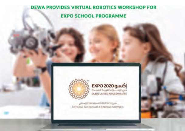
خلال ورشة العمل

شاركت هيئة كهرباء ومياه دبي «ديوا»، في ورشة عمل افتراضية لإطلاع المشاركين في برنامج إكسبو للمدارس على أبرز الروبوتات والتقنيات الروبوتية التي تستخدمها الهيئة في عملياتها، إضافة إلى لحة عامة عن الروبوتات وأنواعها وحالات استخدامها. وتعرف قرابة 1065 من طلاب المدارس على الروبوت الآلي رباعي الأرجل (سبوت)، حيث كانت الهيئة أول مؤسسة خدمتية في المنطقة تستخدم هذا الروبوت في عملياتها الداخلية. وقدمت الهيئة أيضاً شرحاً وافياً عن الروبوتات الصناعية والروبوتات المتنقلة والروبوتات الافتراضية وروبوتات التحكم عن بعد. وتدعم الهيئة كافة الجهود الوطنية الهادفة إلى إنجاح إكسبو 2020 دبي، تنفيذاً لرؤية صاحب السمو الشيخ محمد بن راشد آل مكتوم، نائب رئيس الدولة رئيس مجلس الوزراء حاكم دبي، رعاه الله، في استضافة أفضل نسخة لمعرض إكسبو في إمارة دبي. وانسجاماً مع مسؤوليتها المجتمعية، تولي الهيئة أهمية بالغة لغرس ثقافة الابتكار والإبداع لدى النشء الجديد، وتعميق شغفهم ومعارفهم بأحدث التقنيات الإحلائية مثل الذكاء الاصطناعي، والطائرات من دون طيار، والطباعة ثلاثية الأبعاد، وتقنية البلوك تشين، وإنترنت الأشياء وغيرها، ليكونوا قادة المستقبل وحجر الأساس في عملية التنمية المستدامة، لضمان مستقبل أكثر إشراقاً لأجيالنا القادمة.